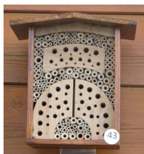
H= 22.5 B= 22 / B= 16