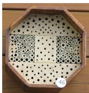
H= 22 B= 22