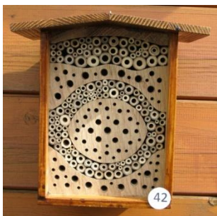
H= 22.5 B= 22 / B=16