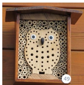
H= 22 B= 22 / B= 16