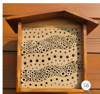
H= 19.5 B= 22/B= 14.5