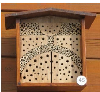
H= 21.5 B= 25 / B= 19