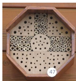
H= 20 B= 20