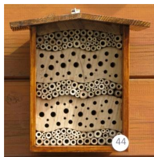
H= 22.5 B= 22 / B= 16